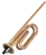
Запчасти для бойлера