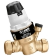
Редукторы давления воды