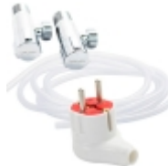
Материалы для бойлеров