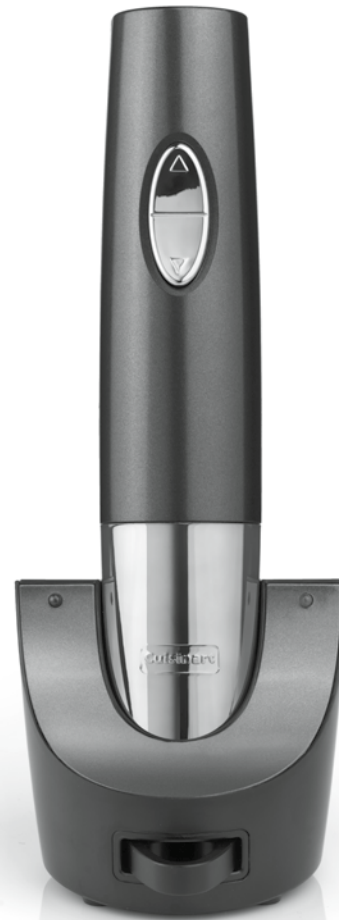
WINE OPENER OUVRE-BOUTEILLE CW050E